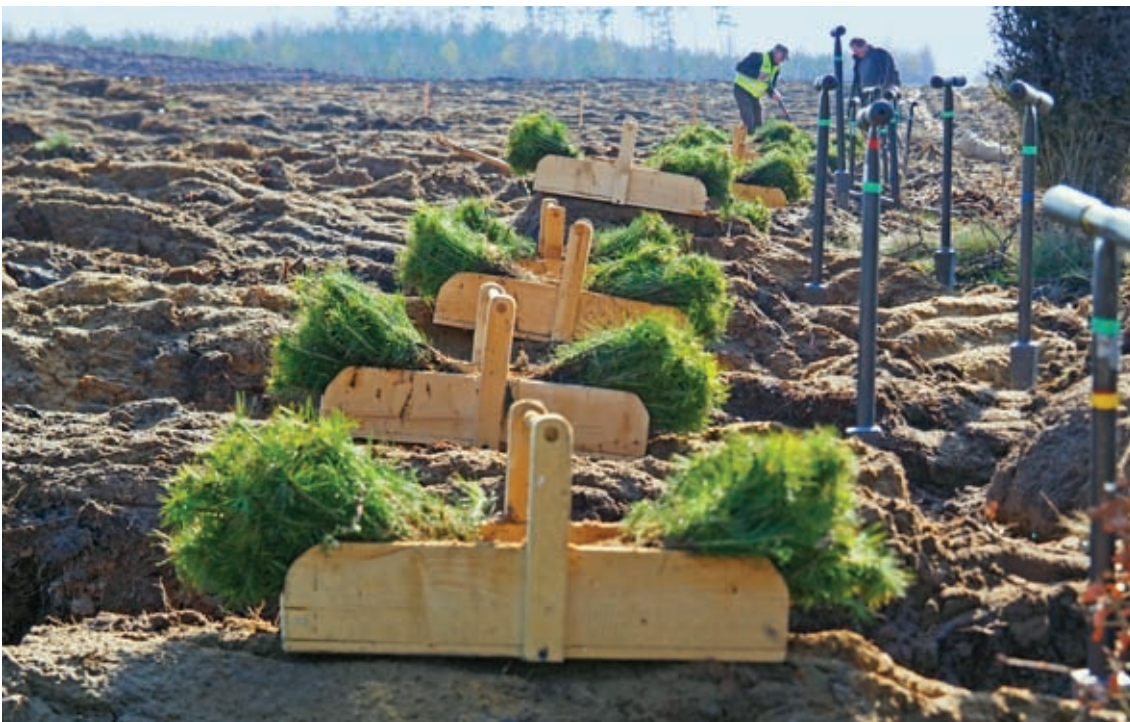
Wiele jest drzewek do posadzenia