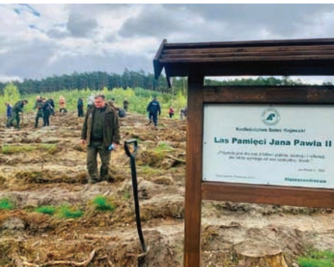
Na zdjęciu z lewej: Tu wyróżnie „Las Pamięci Jana Pawła II”