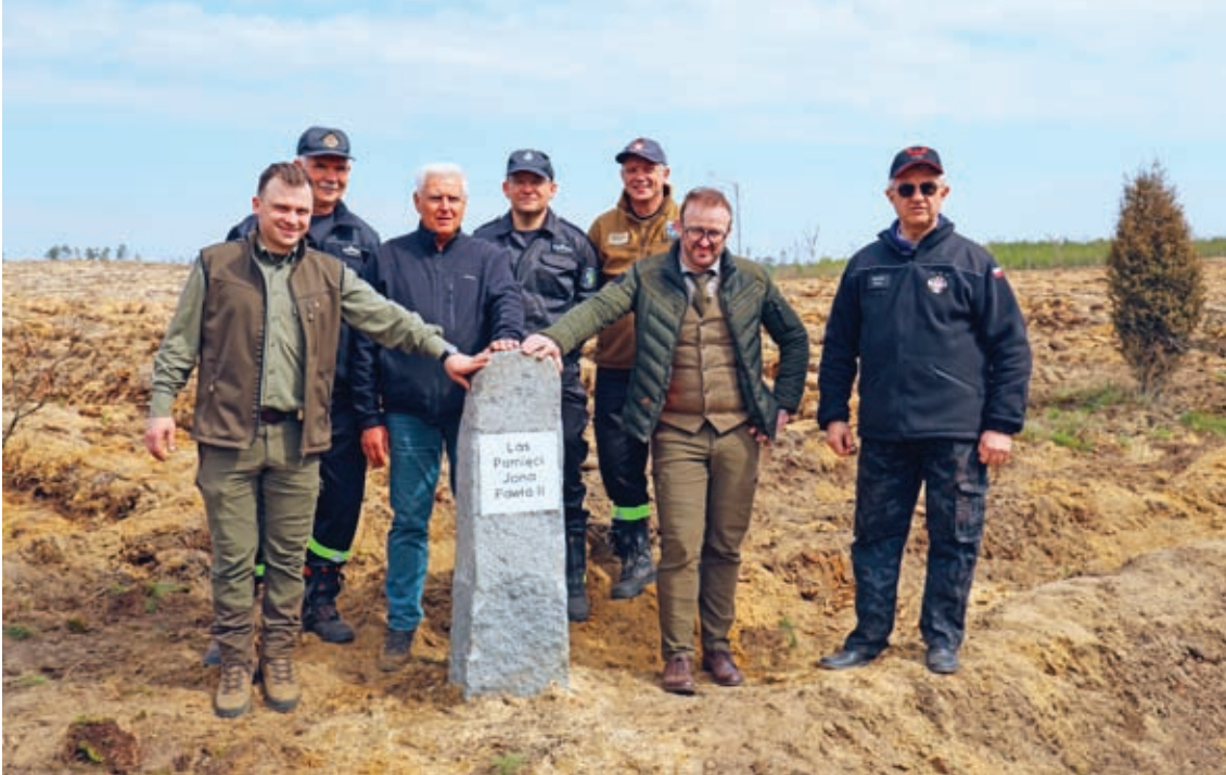
Charakterystyczne dla Borów Tucholskich oznakowanie miejsc, dróg i miejscowości