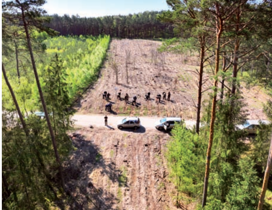
Z lotu ptaka (drona) w Nadleśnictwie Cierpiszewo