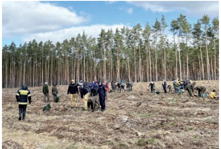
Na zdjęciu powyżej: Tu sadzimy nowe pokolenie lasu