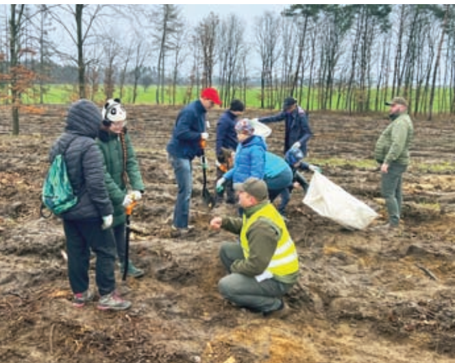
Z lewej: Sadzenie lasu w Nadleśnictwie Runowo

Po nawałnicy – niszczycielskim huraganie z sierpnia 2017 r. odnowienia lasu w Nadleśnictwie Runowo nabrały nowego wymiaru. Wielkość powierzchni przeznaczonych do nasadzeń jest znacznie większa niż to było wcześniej, co wymaga prowadzenia prac odnowieniowych zarówno wiosną, jak i jesienią. Należy jednak zauważyć, że każdego roku zgłasza się wiele osób, które chcą pomóc przy sadzeniu młodego pokolenia lasu. Ludzie chcą osobiście uczestniczyć w odbudowie zniszczonych drzewostanów. Staramy się wyjść naprzeciw oczekiwaniom i przygotowujemy powierzchnie leśne, na których młode drzewka są sadzone przez ochotników. Tak też było w tym roku. Wytypowaliśmy odpowiednie miejsce w Leśnictwie Drzewianowo. Las posadziliśmy tam 1 kwietnia, w ramach ogólnopolskiej akcji „Łączą nas drzewa”. W wydarzeniu uczestniczyło ponad 100 osób. Byli to m.in. strażacy z OSP