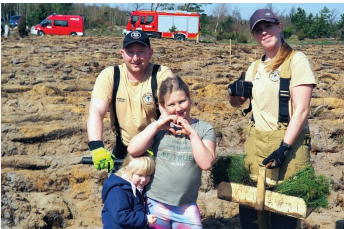
W rodzinie siła!