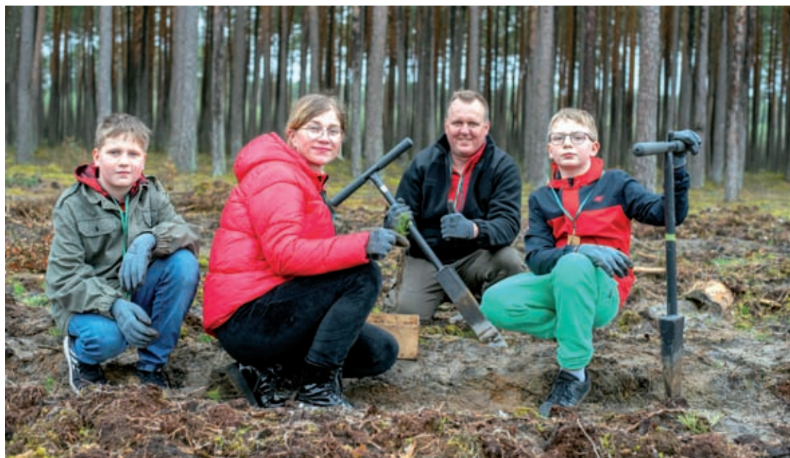
Fragment Lasu Pamięci Jana Pawła II posadziła nasza rodzina