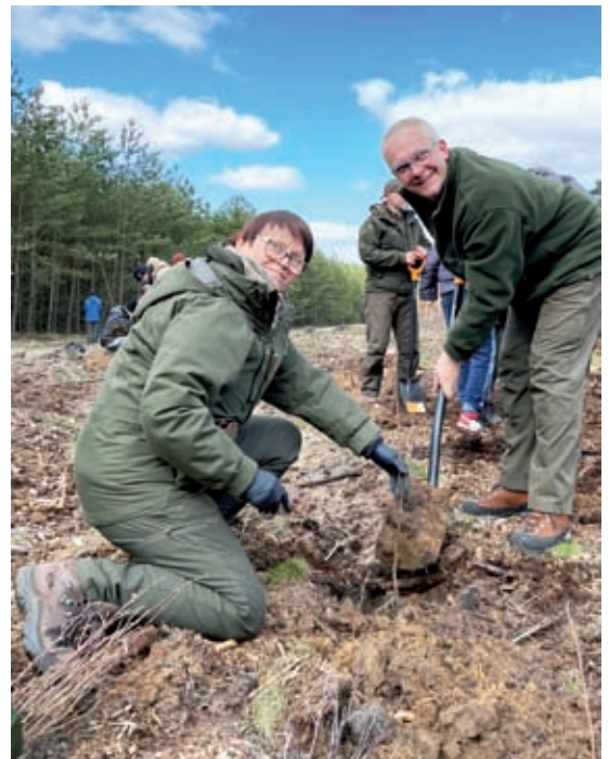
Na zdjęciu obok: Wsparli nas pracownicy biura RDLP w Toruniu