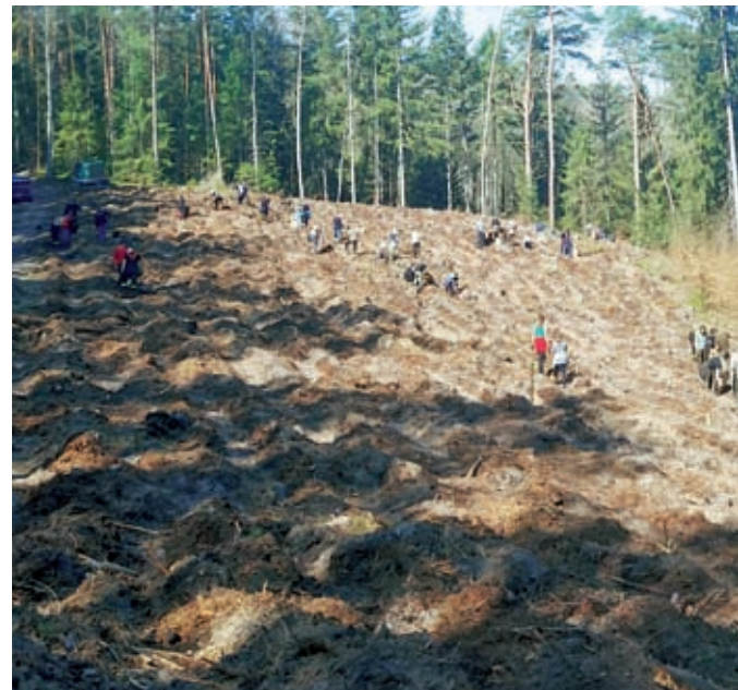
W Nadleśnictwie Przymuszewo uczestnicy akcji „Łączą nas drzewa” posadzili ponad 5 tys. sadzonek drzew

Tekst: Dawid Warzyński