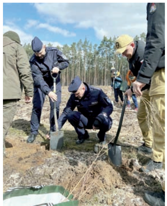
Służby mundurowe tradycyjnie niezawodne.

„Człowiek ma obowiązek ograniczać zagrożenia dla przyrody, otaczając szczególną troską środowisko naturalne, podejmując stosowne działania i tworząc systemy ochronne, przede wszystkim z myślą o dobru wspólnym, a nie zyskach i prywatnych korzyściach.”