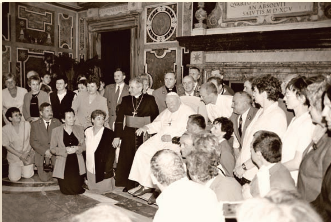
Leśnicy z grupy „toruńskiej” podczas spotkania z papieżem Janem Pawłem II w Kaplicy Klementyńskiej, 28 kwietnia 2004 r.

Kolejny dzień, środę 28 kwietnia 2004 roku, zaczynamy od uczestnictwa we Mszy św. sprawowanej przez księdza kapelana. To kulminacyjny dzień naszego pielgrzymowania, za kilka godzin będziemy uczestniczyć w Audiencji Generalnej u Ojca Świętego na Placu św. Piotra w Watykanie. Wyjeżdżamy spod hotelu w kierunku Rzymu. Dość szybko trafiamy na zakorkowaną obwodnicę, po czym zjeżdżamy w... niewłaściwą drogę. Czas mija, nikt nic nie mówi, choć każdy odczuwa narastającą niepewność. Nie zdążymy na Audiencję? Nasi kierowcy już wcześniej, teraz i później wykazali niezwykły spokój, opanowanie, prawdziwy sztuka, profesjonalizm. W okolicy Placu św. Piotra