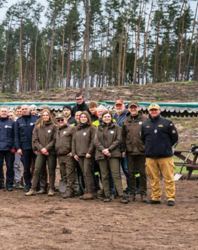
Uczestnicy sadzenia Lasu Pamięci Jana Pawła II w Nadleśnictwie Osie

W sadzeniu młodego lasu uczestniczyli przedstawiciele Ochotniczych Straży Pożarnych działających na naszym terenie, uczniowie i nauczyciele lokalnych szkół, przedszkolak, mieszkańcy pobi-