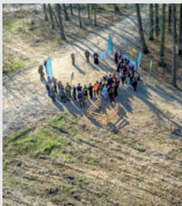
Uczestnicy sadzenia Lasu Pamięci Jana Pawła II w Nadleśnictwie Lutówko.

WYDAWCA Regionalna Dyrekcja Lasów Państwowych w Toruniu ul. Mickiewicza 9, 87-100 Toruń