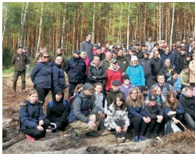
Na zdjęciu z prawej: Uczestnicy (i to jeszcze nie wszyscy) sadzenia lasu w Nadleśnictwie Solec Kujawski